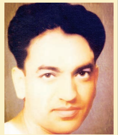
ਜਿਹਦੇ ਵਿਚ ਵਤਨ ਦੀ ਮਿੱਟੀ ਲਈ, ਅੰਤਾਂ ਦਾ ਮੋਹ ਹੋਵੇ

ਜਿਹਦੇ ਵਿਚ ਲਹੂ ਤੇਰੇ ਦੀ, ਰਲੀ ਲਾਲੀ ਤੇ ਲੋਅ ਹੋਵੇ