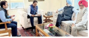
ਵਿਦੇਸ਼ ਮੰਤਰਾਲੇ ਦੇ ਅਧਿਕਾਰੀਆਂ ਨਾਲ ਗੱਲਬਾਤ ਕਰਦੇ ਹੋਏ ਦਿੱਲੀ ਕਮੇਟੀ ਦੇ ਆਗੂ।

■ ਵਿਦੇਸ਼ ਮੰਤਰਾਲੇ ਦੇ ਜੁਆਇੰਟ ਸਕੱਤਰ ਨੇ ਸਿੱਖ ਪਰਿਵਾਰਾਂ ਦੀ ਸੁਰੱਖਿਅਤ ਵਾਪਸੀ ਦਾ ਭਰੋਸਾ ਦਿੱਤਾ