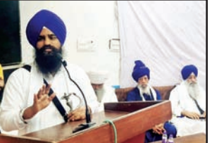
ਪੰਥਕ ਜਥੇਬੰਦੀਆਂ ਨੂੰ ਸੰਬੋਧਨ ਕਰਦੇ ਹੋਏ ਜਥੇਦਾਰ ਗਿਆਨੀ ਕੁਲਦੀਪ ਸਿੰਘ ਗੜਗੱਜ।

ਪੰਥਕ ਸਹਿਮਤੀ ਤੋਂ ਬਿਨਾਂ ਐਕਟ ਪਰਵਾਨ ਨਹੀਂ: ਜਥੇਦਾਰ