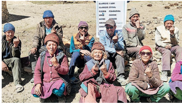
ਲੱਦਾਖ ਦੇ ਲੋਕ ਵੋਟ ਪਾਉਣ ਮਗਰੋਂ ਆਪਣੀਆਂ ਉਂਗਲਾਂ 'ਤੇ ਲੱਗੀ ਹੋਈ ਸਿਆਹੀ ਦਿਖਾਉਂਦੇ ਹੋਏ।