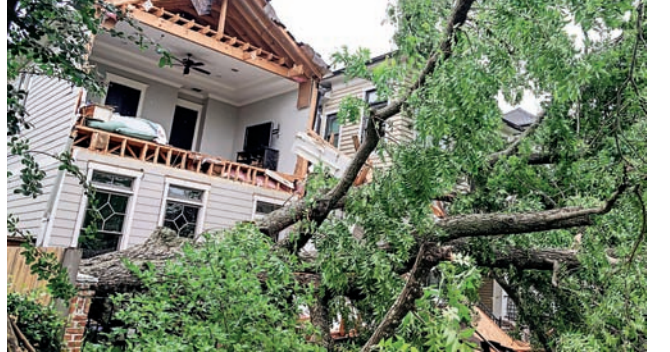
ਹਿਊਸਟਨ, ਟੈਕਸਾਸ 'ਚ ਆਏ ਤੂਫਾਨ ਕਾਰਨ ਡਿੱਗੇ ਦਰੱਖਤ ਤੇ ਮਕਾਨਾਂ ਦੀਆਂ ਟੁੱਟੀਆਂ ਛੱਤਾਂ।

ਸੈਕਰਾਮੈਂਟੋ, (ਹੁਸਨ ਲੜੋਆ ਬੰਗਾ/ਪੰਜਾਬ ਮੇਲ)- ਟੈਕਸਾਸ 'ਚ ਖਤਰਨਾਕ ਤੂਫਾਨ 'ਚ 7 ਲੋਕਾਂ ਦੇ ਮਾਰੇ ਜਾਣ ਤੇ ਅਰਬ ਡਾਲਰਾਂ ਦਾ ਨੁਕਸਾਨ ਹੋਣ ਦੀਆਂ ਖਬਰਾਂ ਹਨ। 100 ਮੀਲ ਪ੍ਰਤੀ ਘੰਟੇ ਦੀ ਰਫਤਾਰ ਨਾਲ ਚੱਲੀਆਂ ਹਵਾਵਾਂ ਨੇ ਵੱਡੀ ਪੱਧਰ 'ਤੇ ਨੁਕਸਾਨ ਕੀਤਾ ਹੈ। ਜਗ੍ਹਾ-ਜਗ੍ਹਾ ਦਰੱਖਤ ਡਿੱਗ ਪਏ ਹਨ ਤੇ ਬਿਜਲੀ ਦੀ ਸਪਲਾਈ ਵੱਡੀ ਪੱਧਰ 'ਤੇ ਪ੍ਰਭਾਵਿਤ ਹੋਈ ਹੈ। ਹਜ਼ਾਰਾਂ ਲੋਕ ਬਿਨਾਂ ਬਿਜਲੀ ਦੇ ਰਹਿਣ ਲਈ ਮਜਬੂਰ ਹਨ। ਤੂਫਾਨ ਤੋਂ ਬਾਅਦ ਹਿਊਸਟਨ ਖੇਤਰ ਵਿਚ ਤਪਸ਼ ਨੇ ਲੋਕਾਂ ਦਾ ਜੀਣਾ ਬੇਹਾਲ ਕਰ ਦਿੱਤਾ ਹੈ। ਉੱਚੀਆਂ ਇਮਾਰਤਾਂ ਦੀਆਂ ਖਿੜਕੀਆਂ ਟੁੱਟ ਗਈਆਂ ਹਨ ਅਤੇ ਮਕਾਨਾਂ ਦੀਆਂ ਕੰਧਾਂ ਤੇ ਛੱਤਾਂ ਨੂੰ ਨੁਕਸਾਨ ਪੁੱਜਾ ਹੈ। ਹਿਊਸਟਨ ਨੈਸ਼ਨਲ ਵੈਦਰ ਸਰਵਿਸ ਨੇ ਕਿਹਾ ਹੈ ਕਿ ਟਰਾਂਸਮਿਸ਼ਨ ਲਾਈਨਾਂ ਨੂੰ ਪੁੱਜੇ ਨੁਕਸਾਨ ਕਾਰਨ ਬਿਜਲੀ ਬਹਾਲ ਕਰਨ ਵਿਚ ਕਈ ਦਿਨ ਜਾਂ ਹਫਤੇ ਲੱਗ ਸਕਦੇ ਹਨ। ਦਫਤਰ ਨੇ ਜਾਰੀ ਬਿਆਨ