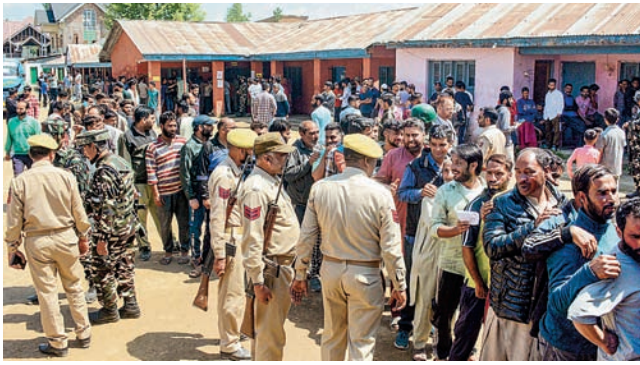
ਬਾਰਾਮੂਲਾ ਦੇ ਪੋਲਿੰਗ ਬੁਥ 'ਤੇ ਸੁਰੱਖਿਆ ਬਲਾਂ ਦੀ ਨਿਗਰਾਨੀ ਹੇਠ ਵੋਟਰਾਂ ਦੀ ਲੱਗੀ ਲੰਮੀ ਕਤਾਰ।