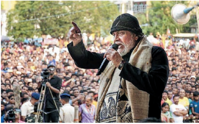
ਦੌਰਾਨ ਕੱਚ ਦੀਆਂ ਬੋਤਲਾਂ ਤੇ ਪੱਥਰ ਸੁੱਟਣ ਦਾ ਦੋਸ਼ ਲਾਇਆ