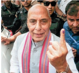
ਸੋਮਵਾਰ ਨੂੰ ਰੱਖਿਆ ਮੰਤਰੀ ਰਾਜਨਾਥ ਸਿੰਘ ਵੋਟ ਪਾਉਣ ਮਗਰੋਂ ਉਂਗਲ 'ਤੇ ਲੱਗੀ ਸਿਆਹੀ ਦਿਖਾਉਂਦੇ ਹੋਏ।

ਮਤਦਾਨ ਹੋਵੇਗਾ। ਵੋਟਾਂ ਦੀ ਗਿਣਤੀ 4 ਜੂਨ ਨੂੰ ਹੋਣੀ ਹੈ। ਪੰਜਵੇਂ ਗੇੜ ਵਿਚ ਬਿਹਾਰ 'ਚ 53.78 ਫੀਸਦੀ, ਜੰਮੂ ਕਸ਼ਮੀਰ 59 ਫੀਸਦੀ, ਝਾਰਖੰਡ 63.06 ਫੀਸਦੀ, ਉੜੀਸਾ 62.23 ਫੀਸਦੀ, ਯੂ.ਪੀ. 57.79 ਫੀਸਦੀ ਤੇ ਲੱਦਾਖ ਵਿਚ 67.15 ਫੀਸਦੀ ਮਤਦਾਨ ਹੋਇਆ। ਚੋਣ ਕਮਿਸ਼ਨ ਵਲੋਂ ਉਪਲਬਧ ਕਰਵਾਏ ਅੰਕੜਿਆਂ ਮੁਤਾਬਕ