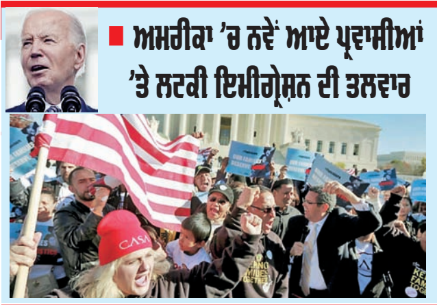
■ ਅਮਰੀਕਾ 'ਚ ਨਵੇਂ ਆਏ ਪ੍ਰਵਾਸੀਆਂ 'ਤੇ ਲਟਕੀ ਇਮੀਗ੍ਰੇਸ਼ਨ ਦੀ ਤਲਵਾਰ

ਵਾਸ਼ਿੰਗਟਨ ਡੀ.ਸੀ., (ਰਾਜ ਗੋਗਨਾ/ਪੰਜਾਬ ਮੇਲ)- ਅਮਰੀਕਾ 'ਚ ਗੈਰ ਕਾਨੂੰਨੀ ਤੌਰ 'ਤੇ ਆਉਣ ਵਾਲੇ ਪ੍ਰਵਾਸੀਆਂ ਨੂੰ ਹੁਣ ਮੁਸ਼ਕਿਲਾਂ ਦਾ ਸਾਹਮਣਾ ਕਰਨਾ ਪੈ ਸਕਦਾ ਹੈ। ਉਨ੍ਹਾਂ ਦੇ ਕੇਸ ਪਾਸ ਨਾ ਹੋਣ ਦੀ ਸੂਰਤ ਵਿਚ ਉਨ੍ਹਾਂ ਨੂੰ 6 ਮਹੀਨੇ ਦੇ ਅੰਦਰ-ਅੰਦਰ ਵਾਪਸ ਆਪਣੇ ਮੁਲਕ ਭੇਜਿਆ ਜਾ ਸਕਦਾ ਹੈ। ਅਮਰੀਕੀ ਰਾਸ਼ਟਰਪਤੀ ਜੋਅ ਬਾਇਡਨ ਨੇ ਕਿਹਾ ਹੈ ਕਿ ਇਮੀਗ੍ਰੇਸ਼ਨ ਨੀਤੀ ਵਿਚ ਬਹੁਤ ਜਲਦ ਵੱਡੇ ਬਦਲਾਅ ਕੀਤੇ ਜਾ ਰਹੇ ਹਨ, ਜਿਸ ਨਾਲ ਅਮਰੀਕਾ ਵਿਚ ਬੇਲੋੜੇ ਪ੍ਰਵਾਸੀਆਂ ਨੂੰ ਬਾਹਰ ਕੱਢਣ ਲਈ ਉਪਰਾਲੇ ਕੀਤੇ ਜਾਣਗੇ। ਇਸ ਨਾਲ ਅਮਰੀਕਾ 'ਚ ਨਵੇਂ ਆਉਣ ਵਾਲੇ ਪ੍ਰਵਾਸੀਆਂ ਦੇ ਸਿਰ 'ਤੇ ਇਮੀਗ੍ਰੇਸ਼ਨ ਨਾਲ ਸੰਬੰਧਤ ਤਲਵਾਰ ਲਟਕ ਗਈ ਹੈ।