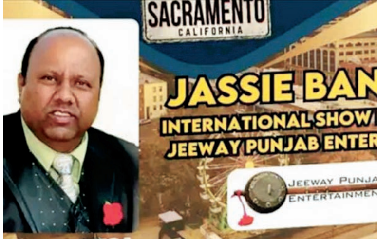
ਜੀਵੇ ਪੰਜਾਬ ਜੱਸੀ ਬੰਗਾ।