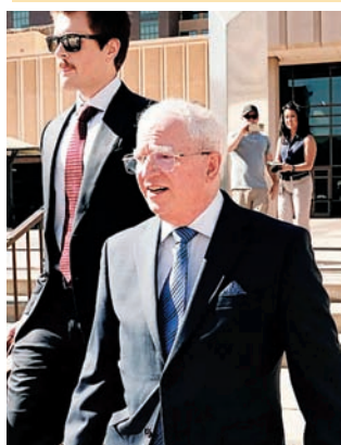
ਡੋਨਲਡ ਟਰੰਪ ਦੇ ਸਾਬਕਾ ਵਕੀਲ ਜੌਹਨ ਈਸਟਮੈਨ ਅਦਾਲਤ 'ਚ ਪੇਸ਼ ਹੋਣ ਲਈ ਜਾਂਦੇ ਹੋਏ।

■ 2020 ਚੋਣ ਨਤੀਜਿਆਂ 'ਚ ਵਿਘਨ ਪਾਉਣ ਦਾ ਮਾਮਲਾ