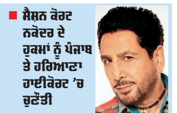
■ ਸੈਸ਼ਨ ਕੋਰਟ ਨਕੋਦਰ ਦੇ ਹੁਕਮਾਂ ਨੂੰ ਪੰਜਾਬ ਤੇ ਹਰਿਆਣਾ ਹਾਈਕੋਰਟ 'ਚ ਚੁਣੌਤੀ