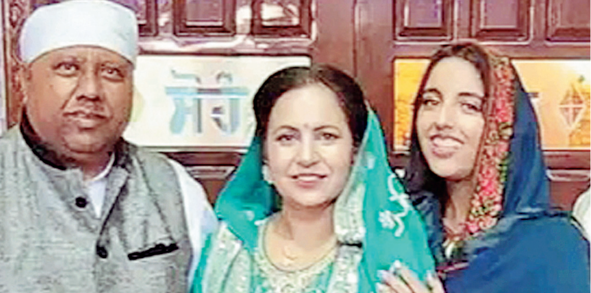
ਧਾਰਮਿਕ ਸਮਾਗਮ 'ਤੇ ਪਰਿਵਾਰ ਨਾਲ ਜੱਸੀ ਬੰਗਾ।