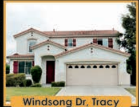
Windsong Dr, Tracy