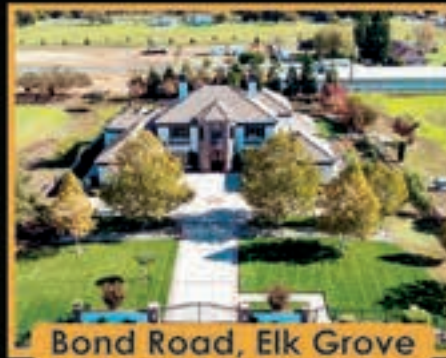
Bond Road, Elk Grove