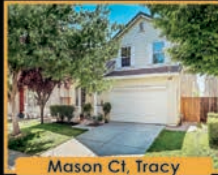
Mason Ct, Tracy