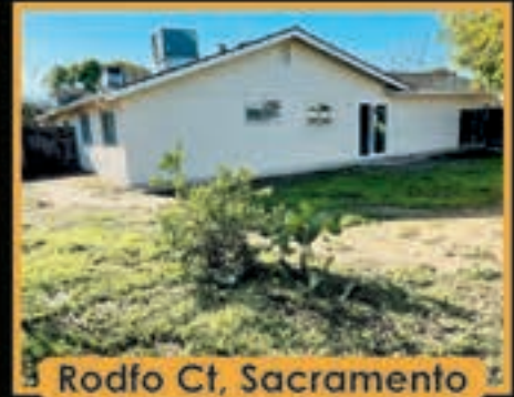
Rodfo Ct, Sacramento