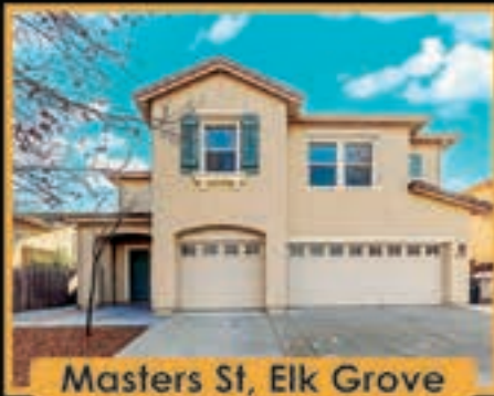
Masters St, Elk Grove