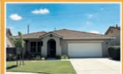
Pawcatuck Way, Rancho Cordova