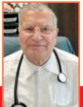
Kharati Kamboj Ayurvedic Prescription