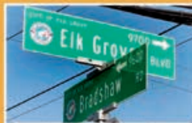
Bradshaw Road, Elk Grove