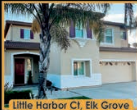
Little Harbor Ct, Elk Grove