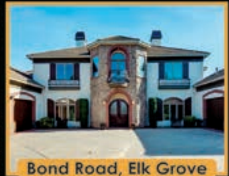
Bond Road, Elk Grove