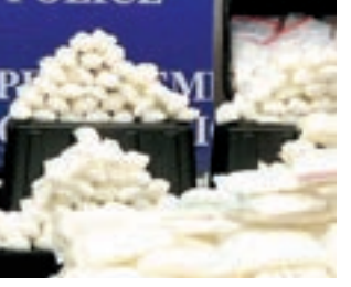
ਡਰੱਗ ਤਸਕਰਾਂ ਕੋਲੋਂ ਬਰਾਮਦ ਨਸ਼ੀਲੇ ਪਦਾਰਥ।

ਸੈਕਰਾਮੈਂਟੋ, (ਹੁਸਨ ਲੜੋਆ ਬੰਗਾ/ਪੰਜਾਬ ਮੇਲ)- ਐਰਜ਼ੋਨਾ ਅਧਿਕਾਰੀਆਂ ਨੇ ਡਰੱਗ ਤਸਕਰਾਂ ਨੂੰ ਨਿਸ਼ਾਨਾ ਬਣਾਉਂਦਿਆਂ ਭਾਰੀ ਮਾਤਰਾ 'ਚ ਨਸ਼ੀਲੇ ਪਦਾਰਥ ਬਰਾਮਦ ਕੀਤੇ ਹਨ, ਜਿਨ੍ਹਾਂ ਦੀ ਅਨੁਮਾਨਤ ਕੀਮਤ 1.30 ਕਰੋੜ ਡਾਲਰ ਹੈ। ਡਰੱਗ ਇਨਫੋਰਮੈਂਟ ਪ੍ਰਸ਼ਾਸਨ ਅਨੁਸਾਰ ਬਰਾਮਦ ਨਸ਼ੀਲੇ ਪਦਾਰਥਾਂ 'ਚ ਭਾਰੀ ਮਾਤਰਾ ਵਿਚ ਹੈਰੋਇਨ, ਕੋਕੀਨ ਤੇ ਫੈਂਟਾਨਾਇਲ ਪਾਊਡਰ ਤੋਂ ਇਲਾਵਾ 45 ਲੱਖ ਤੋਂ ਵਧ ਫੈਂਟਾਨਾਇਲ ਗੋਲੀਆਂ ਤੇ 3100 ਪਾਉਂਡ ਮੈਥੈਮੈਟਾਮਾਫੀਨ