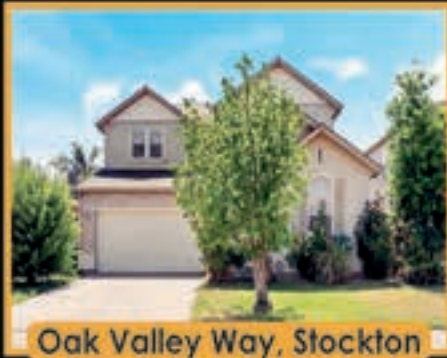
Oak Valley Way, Stockton