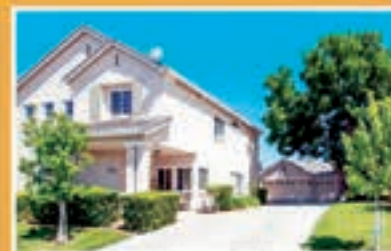
Neutra Way, Elk Grove