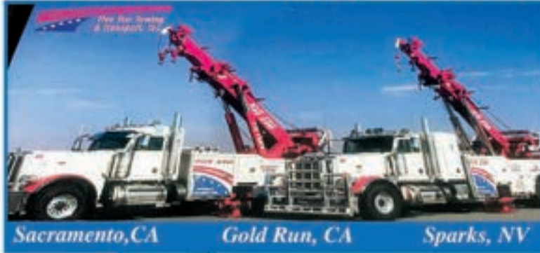
Sacramento, CA Gold Run, CA Sparks, NV