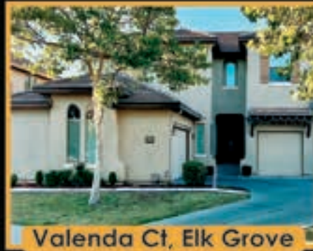
Valenda Ct, Elk Grove