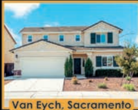
Van Eych, Sacramento